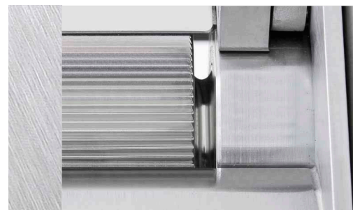
Reinigungsfreundliche Bauweise: Hygienradius an der Transport- und Abstreiferwalze